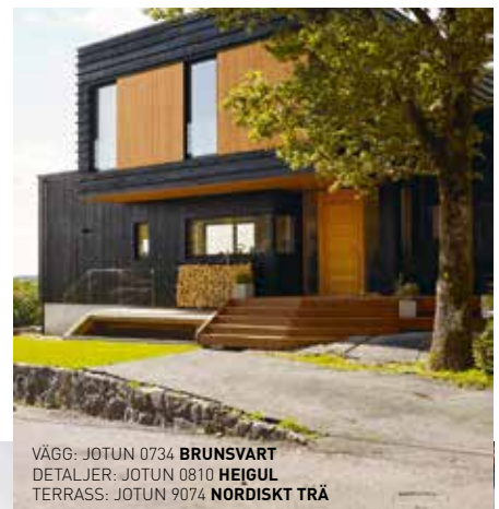
VÄGG: JOTUN 0734 BRUNSVART DETALJER: JOTUN 0810 HEIGUL TERRASS: JOTUN 9074 NORDISKT TRÄ