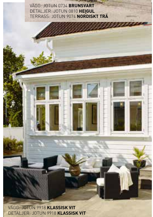
VÄGG: JOTUN 9918 KLASSISK VIT DETALJER: JOTUN 9918 KLASSISK VIT

Jotun arbetar kontinuerligt för att kunna erbjuda marknadens bästa verktyg vid kulörval. Jotuns kulörexperter arbetar kreativt med att överföra trender till estetiskt fungerande kulörer och färgsättningsförslag. Jotuns laboratorium för Kulörteknologi har den tekniska kompetensen om färgpigment för att kunna ta fram kulörrecept som ger både vackra och hållbara kulörer. Tillsammans ger de dig möjlighet att välja bland marknadens bästa kulörutbud. Och du kan vara trygg på att kulöråtergivning och slutresultat blir av bästa kvalitet.