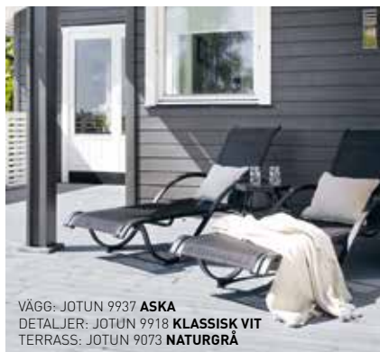
VÄGG: JOTUN 9937 ASKA DETALJER: JOTUN 9918 KLASSISK VIT TERRASS: JOTUN 9073 NATURGRÅ

På utefarger.jotun.se hittar du både inspiration och tydlig vägledning vid kulörval.